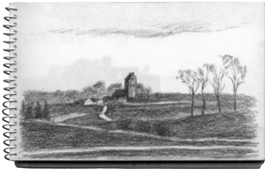
Udsigt fra Mønge mod Valby kirke. Fra Viggo Bentzons skitsebog.

begyndende efterår. Huset havde ikke el dengang - så det kunne være noget af en oplevelse at gå op ad den lange trappe med regn og vind susende om ørerne.