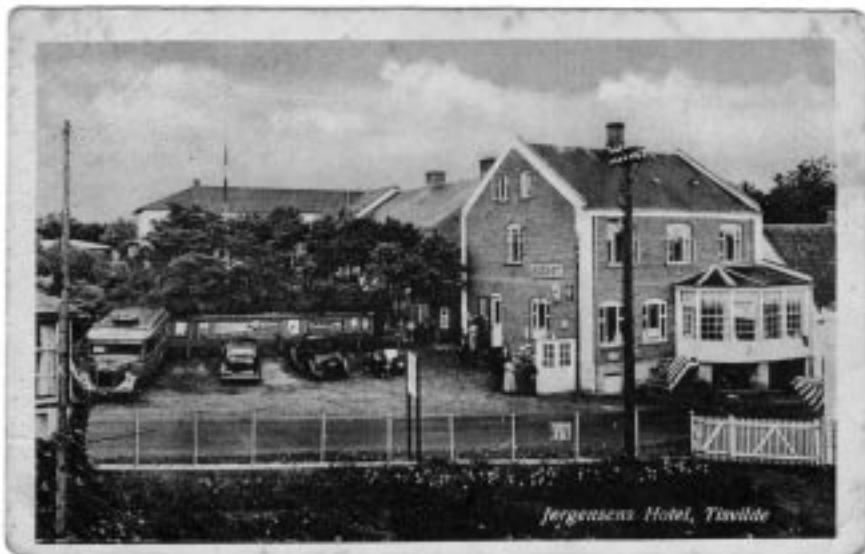
Jørgensens Hotel i Tsvildeleje i 1930'erne inden hotellet skiftede navn til Hotel Tsvildeleje.