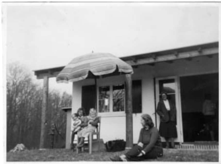
Malene og Lone under parasollen på terrassen – med en meget livagtig dukke.