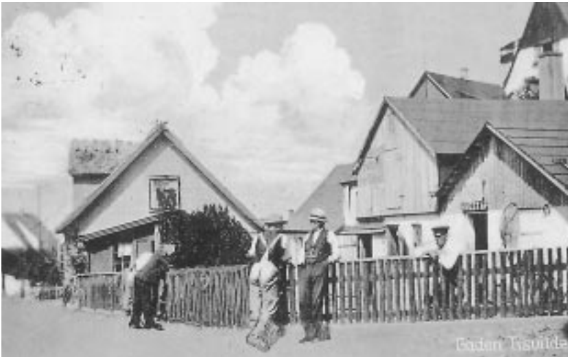
Fiskerne foran »Vesta«. (Gl. postkort)

Først og fremmest bebyggelsen. Da jeg som syvårig fik plaget mine forældre til at give mig lov til at gå alene ind i Tisvilde By, drikke en sodavand på kroen og gå tilbage