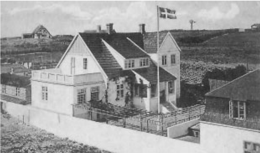
Frøken Klücker store villa bag »Fotoboden«. (Gl. postkort)

Der var Frydensberg fra hjørnet, hvor der nu er café, og som, selv om vinteren, havde grønt og blomster i et omfang, der var en større by værdig. Og den excentriske