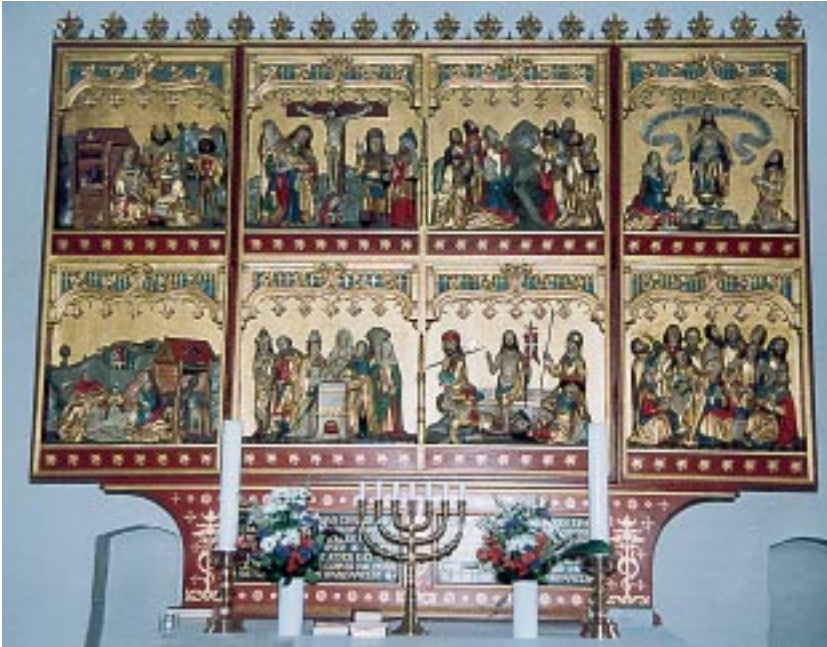
Altartavlen i sin restaurerede skikkelse.

Gudmandsen'er minder om slægter, der hørte til i det gamle Tisvildeleje; fiskere og vognmænd var en del af dem.