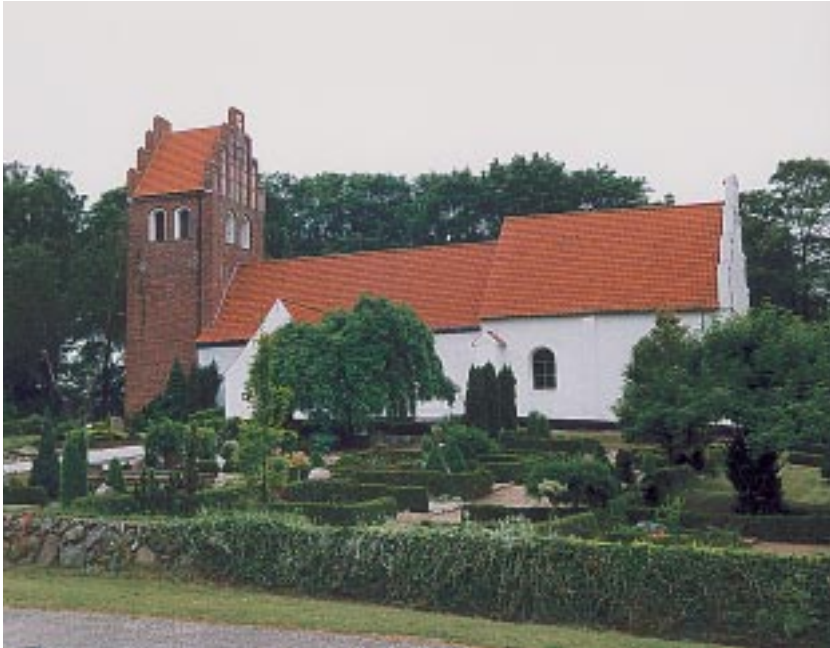
Tibirke kirke som den ser ud i dag.

hvor bl.a. piger, som var »kommet uheldigt af sted« skulle stå offentligt til skue under gudstjenesten. Ja, tiderne har da heldigvis i nogen retninger forandret sig til det bedre, selv om der i vore dage er mange andre måder at komme i gabestokken på!