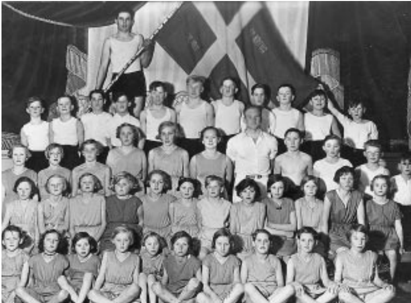
Vejby gymnasterne 1937-38 med hele 14 drenge og piger fra Blistrup.