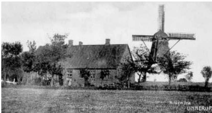
Unnerups smukke gamle mølle. (Gl. postkort)

Når man i min barn- og ungdom, der tog sin begyndelse i 1923, skuede mod syd fra den anselige bronzehøj Embedshøj, der er den sydligste af højene i Bakkebjerg og ligger på min fødegård Damsgårds jord i Koldsbæk, åbenbares følgende panorama i syd og vest: