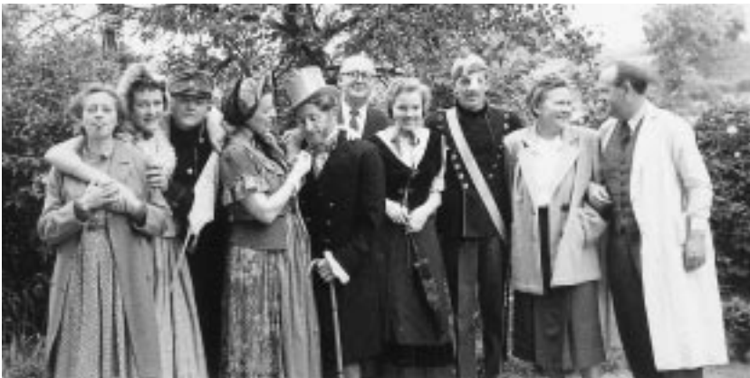
Dilettant på Ørby Baum ca. 1950.

Når vi ville til Holløse fra Vejby var og er der flere muligheder. Var man firhjulet kørende måtte man holde sig til den slagne landevej. Var man derimod gående eller på cykel var man ikke i tvivl – den gamle kirkesti eller skolesti gik i