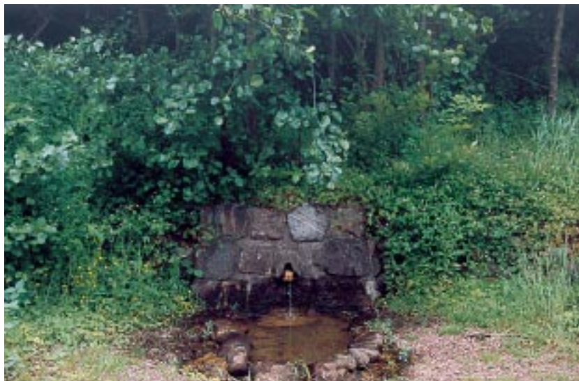
Den dag i dag sprudler kilden Tirsæld ved Tibirke kirke.

menet, når vi på en af skolens cykeludflugter gjorde holdt ved Tibirke kirke: »I gamle dage, da den berømte Helene kilde ved stranden i Tisvilde besøgte af utallige mennesker, som ikke mindst ved Sct. Hanstide søgte helbredelse ved dens vand, kom der en masse offerpenge i »Kildeblokken« i Tisvilde. Disse penge gik dels til fattige og dels til kirkens vedligeholdelse. Da kilden lå i Tibirke sogn, fik man råd til at bygge et stort nyt kor. Vejby, som var nabosogn fik en mindre del af »kagen«, men fik dog råd til at bygge et kor, som var lige så højt som skibet!« - Jeg er aldrig blevet klar over, om der er hold i denne forklaring. Men en god historie er det da.