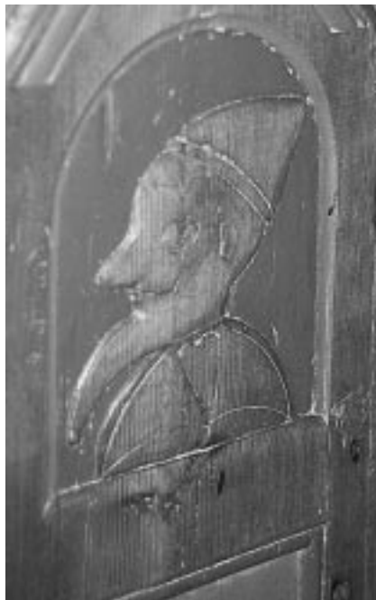
»Narren« fra Asserbohus

Lige til venstre for døren ud til våbenhuset var der i ældre tid en stor sten nedfældet i gulvbelægningen, lidt højere end det øvrige gulv. Det er blevet forklaret, at stedet var en slags »Gabestok«