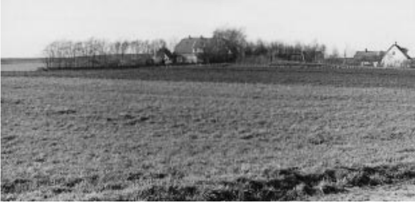
Udsigt fra stationen mod Vejby Skole i trediveerne.

ne. Det gik temmelig meget op ad bakke fra det ene mål til det andet, men det var helt almindeligt i de første mange år de fleste steder. Iøvrigt må det have været en af lejebetingelserne, at gården kunne anvende arealet som græsmark, og det var ikke sjældent at der rundt om på banen lå »kokasser«, som man kunne få sig en glidetur i.