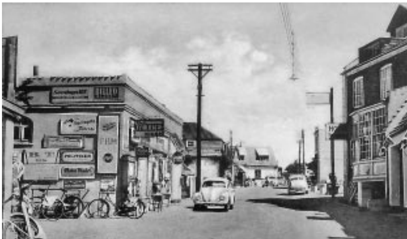
Boghandler Thunebys forretning til venstre. (Gl. postkort)

Ulige værre forholdet det sig med menneskene. De bliver borte efterhånden, men man husker dem. Om de nu var meget anderledes end andre steder, er uvist. Men man erindrer dem som originaler, der på en eller anden måde satte deres præg på området i samme grad som skoven og stranden. Der var de gamle fiskere, som sad på trappestenen foran »Vesta«, mens de unge puslede rundt på pladsen foran. (Det var før vor tids indbyggere fik den - forståelige, men uklædelige - hang til at forskanse sig bag plankeværker). 20 år senere var de gamle væk, og det var de yngres tur til at sidde i døråbningen. Men der var ingen nye til at