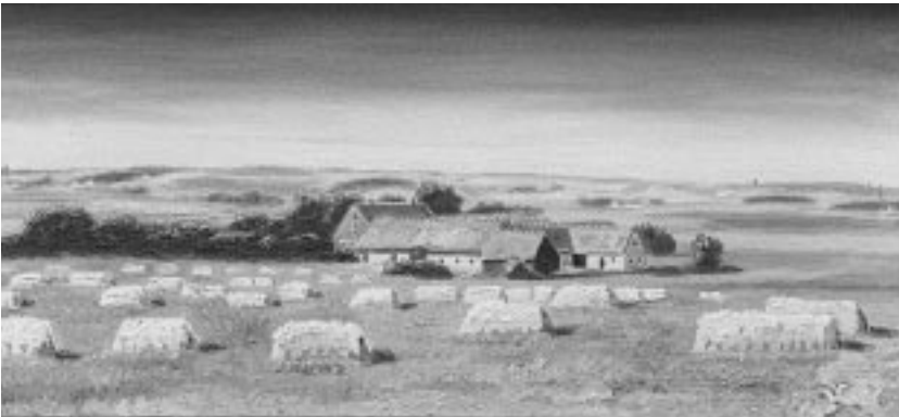
Oliebillede af Damsgården udført af forfatteren.