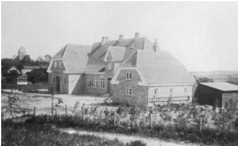
Vejby Skole 1914