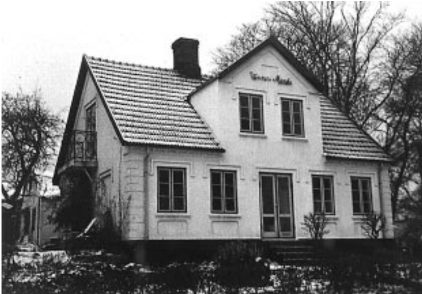
Venners Minde i Tisvilde hvor »Cykelbarberen« boede.

striben i sneen ned til hovedgaden, og så vidste han nok, hvem der havde lavet det. Jeg tror nok, at far måtte give en øl, næste gang han kom.