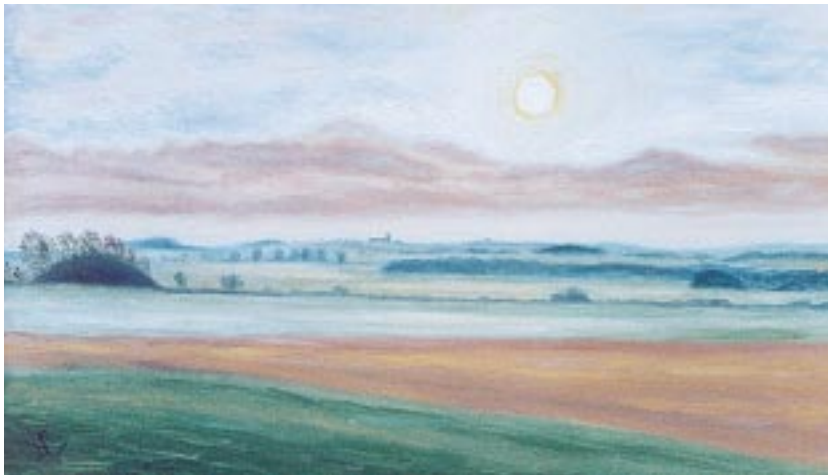
Udsigt fra Koldsbæk mod Vejby. Oliebillede af Hasse Christensen.